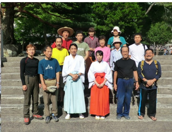
（神社の方と一緒に記念撮影）