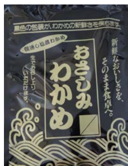
おさしみわかめ 600円