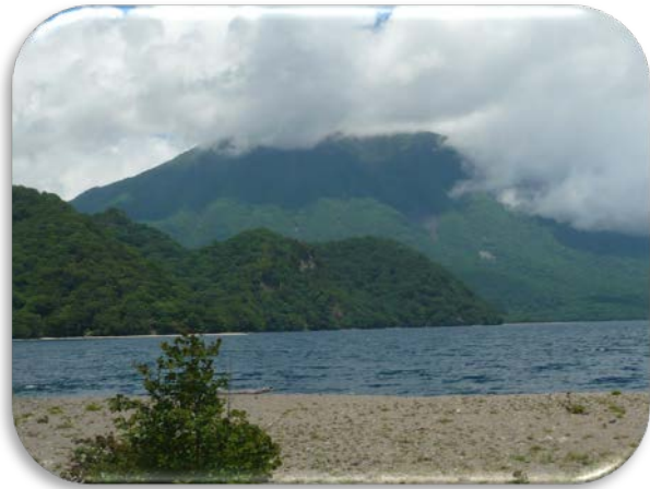
中禅寺湖と男体山