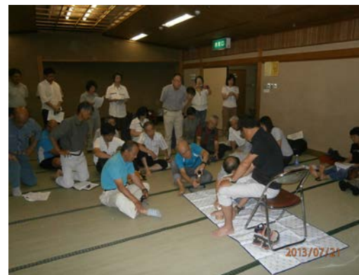
足首の捻挫のテーピング