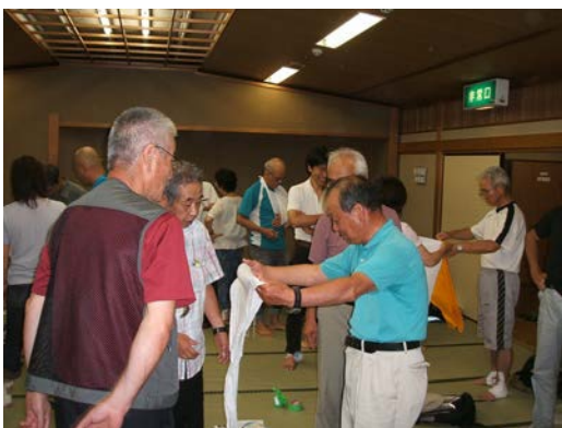
三角巾のたたみ方（これでいいはず?）

懸案としては、当日の参加者（会）が少なからず有り、参加者把握での不備と配布資料不足となった為、募集案内での主旨徹底（資料配布上、事前申し込み）が必要。また、実施期日は梅雨頃（6月）が適切と思われれます。