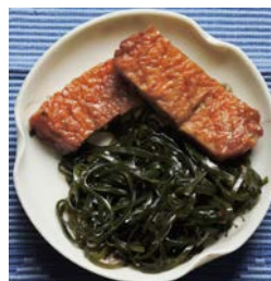
さつま揚げとの煮物