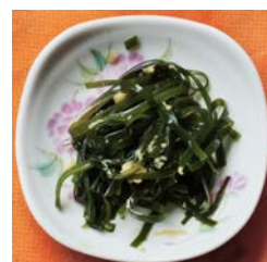
生姜風味のサラダ

申し込み・問い合わせ・・・千葉県勤労者連盟ホームページ・事務局への問い合わせまで ・・・千葉県連盟会長・広木まで： danphiro@zpost.plala.or.jp