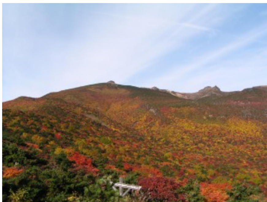
紅葉の安達太良山

千葉県勤労者山岳連盟は、震災直後の昨年4月より気仙沼・石巻を中心に支援活動を行って来ました。この活動を続けて行くために NPO法人「ちば労山ゆう」を立ち上げ4月より石巻市で支援活動を続けています。NPO法人立ち上げを記念し、支援活動への参加に感謝し、東北の名山「安達太良山」にバスハイクを計画しました。被災地の復興支援・会員の交流のために参加をお願いします。